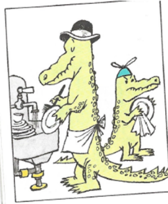
D Décident D'essuyer Divers plats