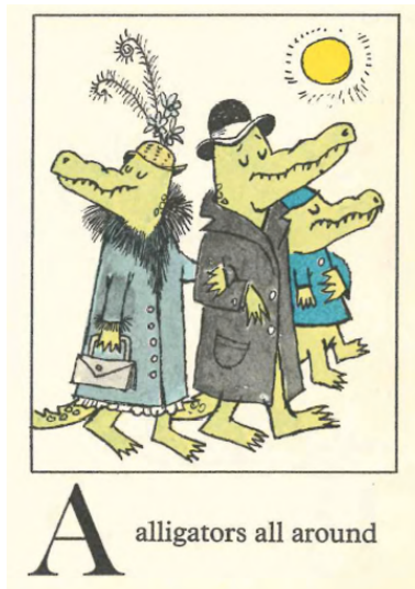
A alligators all around