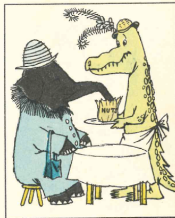
E entertaining elephants