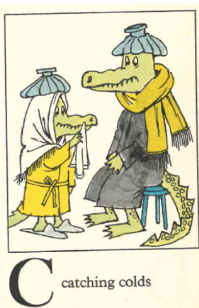
C catching colds