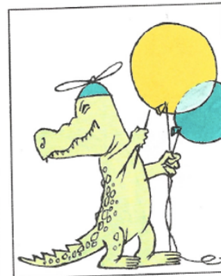
B Balancent des piques sur leurs Ballons