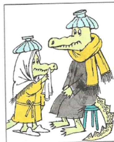
C Couvent en Chœur une vilaine Crève