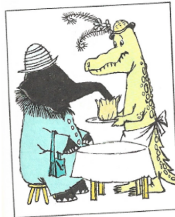
E Emmènent des Éléphants boire le thÉ