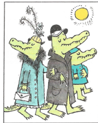
A J'Adore les Alligators quand ils...